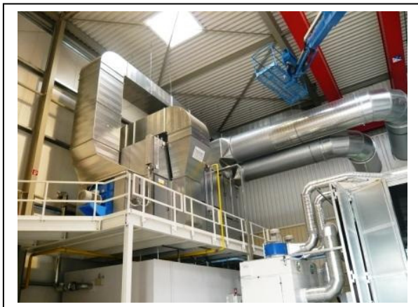
Geräteanordnung auf einer Podestebene